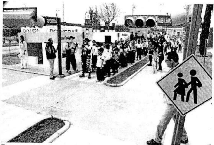
Parque de educación vial en Chihuahua.